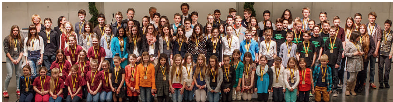
Die erfolgreichen Nachwuchssportler aus der Stadt des Jahres 2013 mit ihren Medaillen.